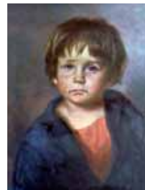
Omslagbeeld: schilder onbekend. Het artikel over Claude Lanzmann is afkomstig uit de Jüdische Allgemeine .