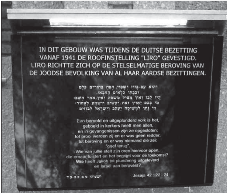
Gedenksteen op de gevel van het pand, waar de Duitse roofbank Liro tijdens de tweede wereldoorlog was gehuisvest

Naar aanleiding van het PWC-onderzoek en het gevoerde overleg tussen de NVB en het CJO zijn partijen overeengekomen dat de NVB een financiële compensatie van totaal 50 miljoen gulden beschikbaar stelt, waarvan 5 miljoen gulden wordt afgezonderd voor individuele claims. 35 Het bedrag van 50 miljoen gulden is samengesteld als volgt: 36