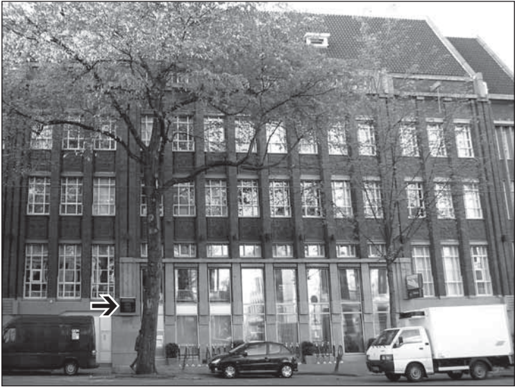
Het pand, met de gedenksteen (zie pijl), waar de Duitse roofbank Liro tijdens de tweede wereldoorlog was gehuisvest.

In de brief van de NVB aan het CJO en het SPI van 10 juli 2000 ('Betreft: geactualiseerde versie van brieven d.d. 14 maart en 12 april 2000') zijn de door de NVB en het CJO overeengekomen bedragen per rubriek gemotiveerd vermeld. 37