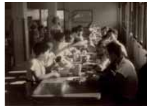
Het artikel op p. 27 verscheen eerder in The Forward .