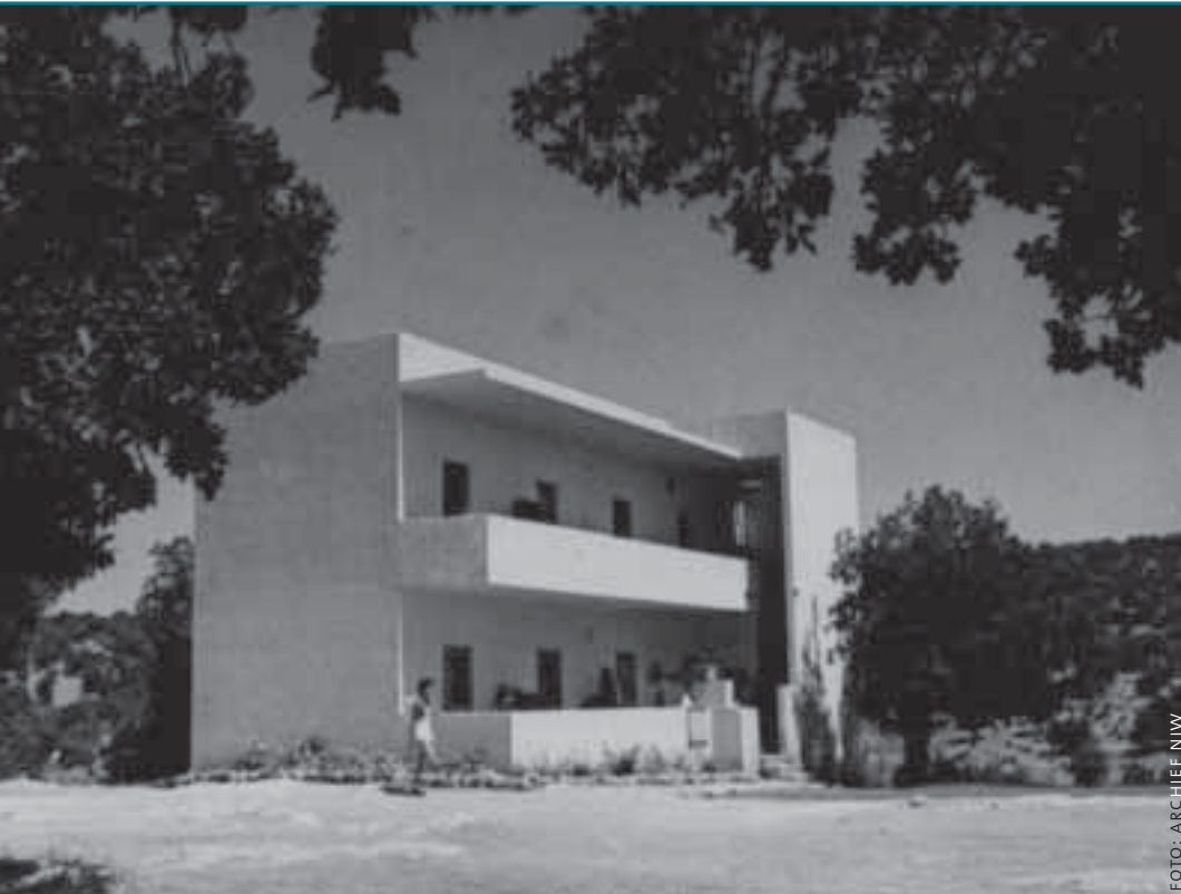
Weeshuis in een kibboets, jaren vijftig