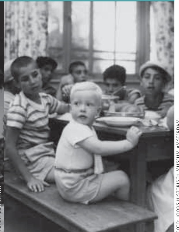
Oorlogswezen in Israël, jaren vijftig

Voor een goed begrip: Le-Ezrath had die paar honderd gulden niet nodig om de begroting rond te krijgen of de nog in de instellingen verblijvende weeskinderen niet van de honger te laten omkomen. In Rekenschap III van Frits Hoek is te lezen dat Le-Ezrath begin jaren zestig kon beschikken over een vermogen van drie miljoen gulden. Men had de paar honderd gulden voor Mimi en Hanna zonder enig probleem kunnen uitbetalen.